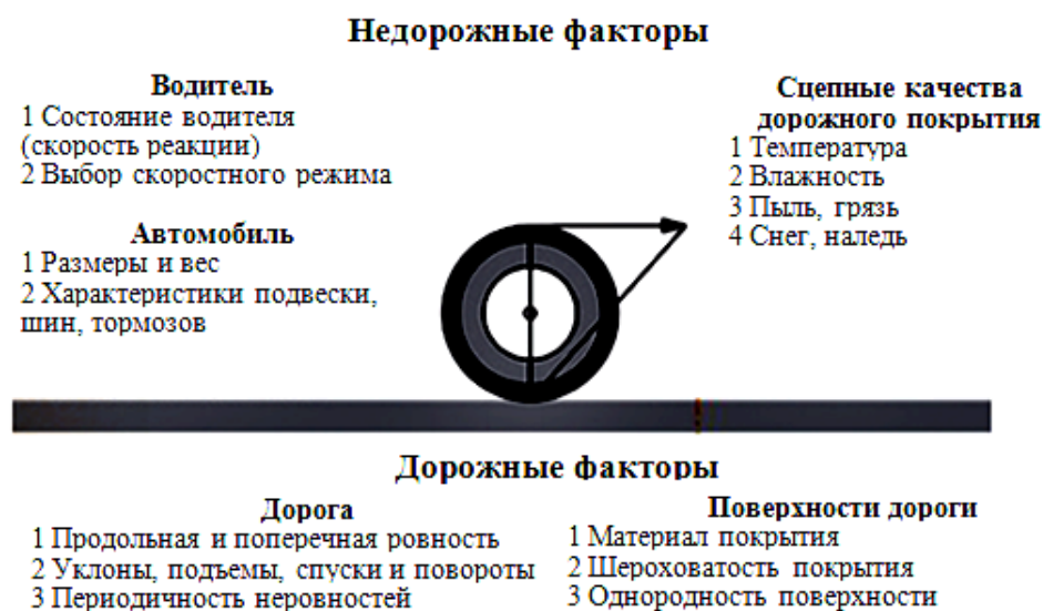
Рисунок 1 – Схема взаимодействия колеса с дорожным покрытием

Из работ [4–7], посвященных исследованию взаимодействия колеса с дорожным покрытием, можно сделать вывод о его зависимости от большого количества факторов, классификация которых приведена на рисунке 1.