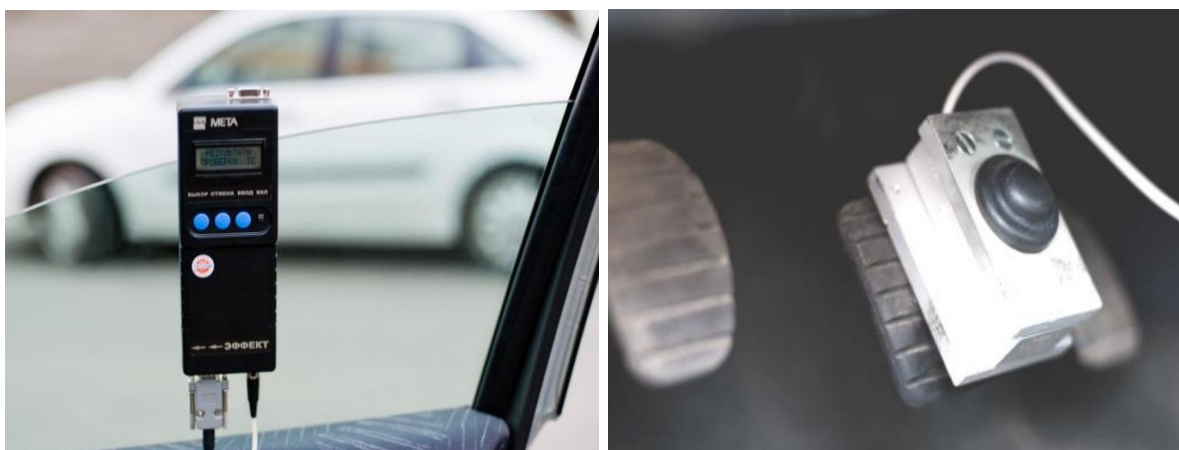
Рисунок 3 – Прибор-деселерометр «Эффект-02»

Одновременно с этим согласно [3] может использоваться прибор-деселерометр «Эффект-02», конструктивно состоящий из электронного блока обработки и отображения информации с органами управления, прикрепляемого на стекло автомобиля, а также датчика усилия, монтируемого на педаль тормоза (рисунок 3).