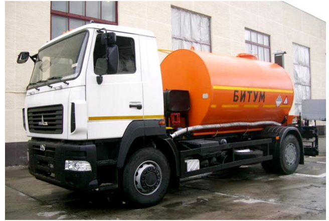
Рисунок 1 – Автогудронатор АРБ-8

К основным агрегатам самоходного автогудронатора АРБ-8 относится распределительная система (рисунок 2).